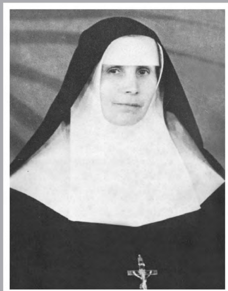
SERVA DE DEUS ANATÓLIA TECLA BODNAR