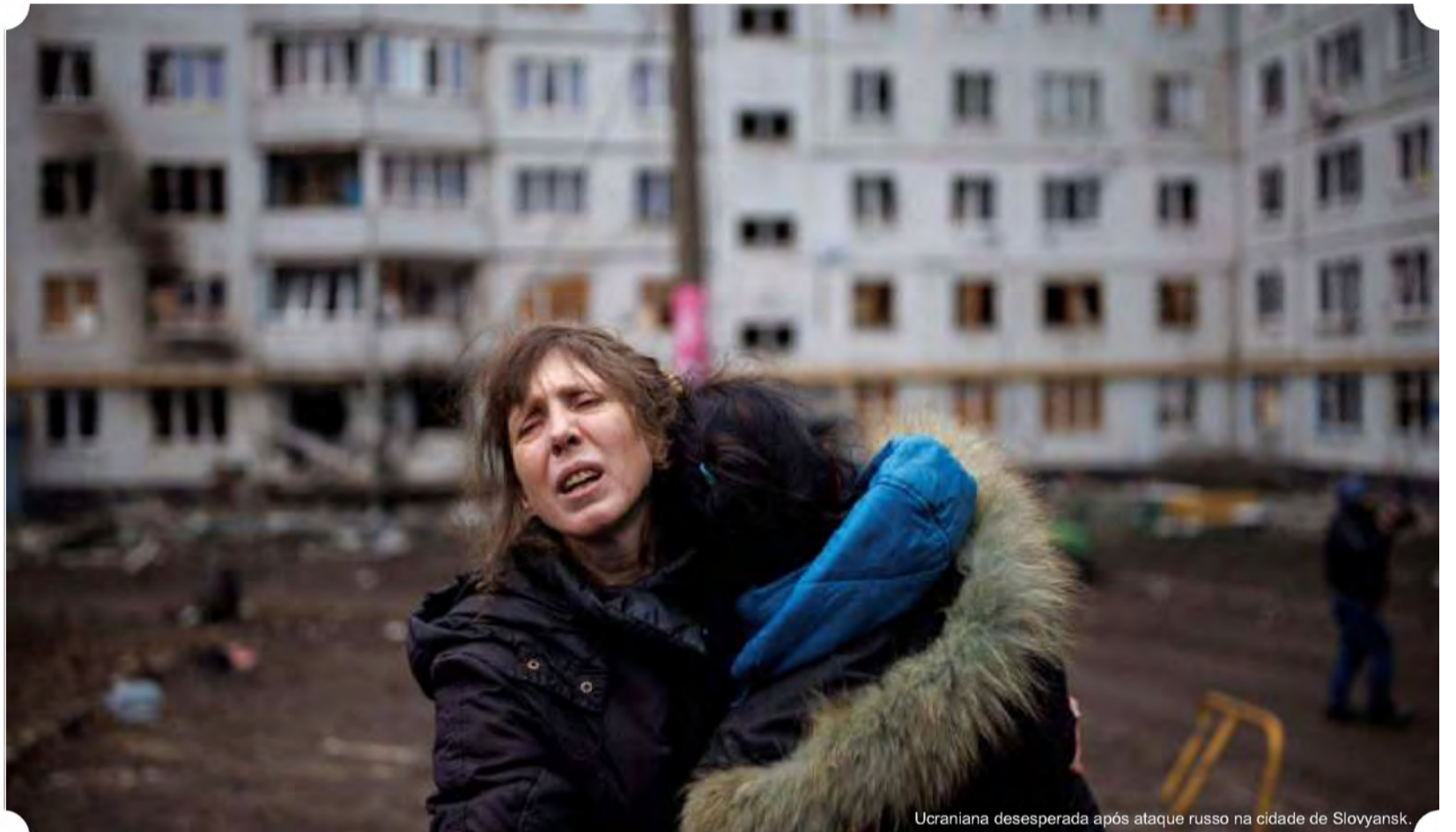
Ucraniana desesperada após ataque russo na cidade de Slovyansk.