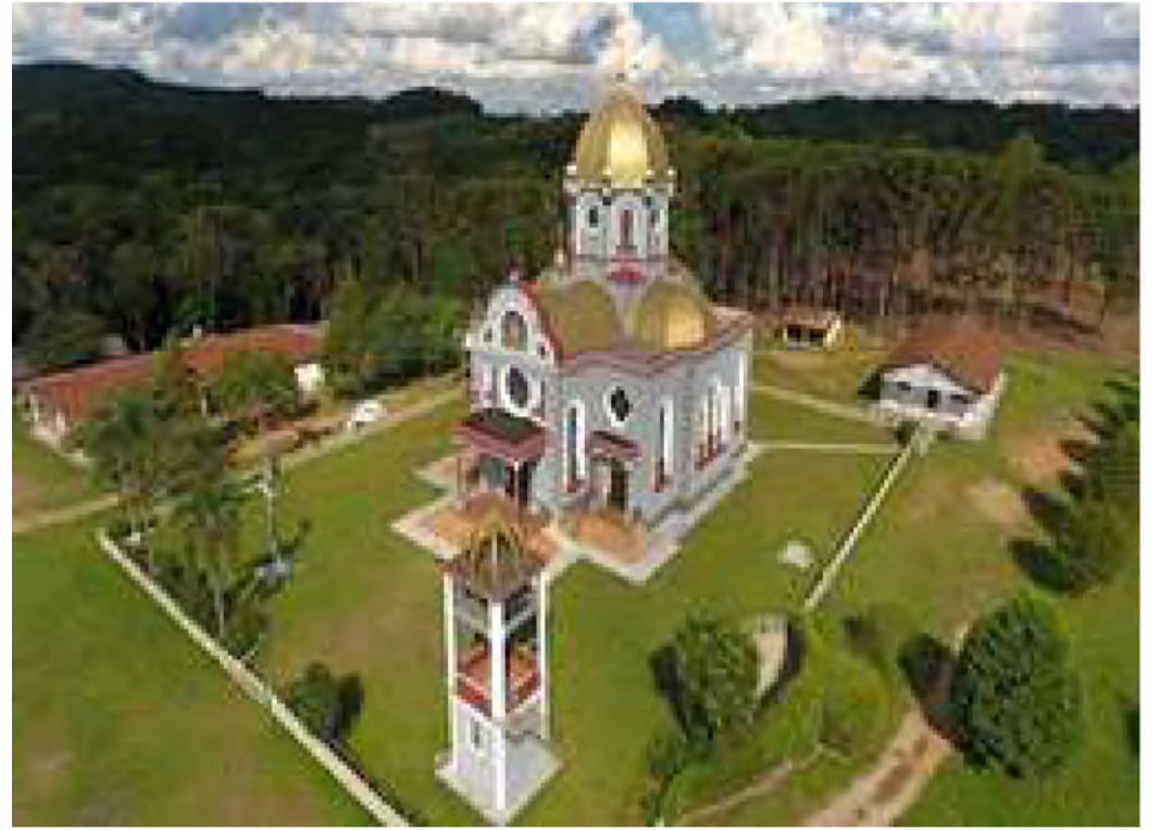
Igreja Ucraniana Nossa Senhora do Patrocínio

Lei N° 2.479/2021 de 13 de outubro de 2021 que “Dispõe sobre a cooficialização da língua ucraniana à língua portuguesa, no Município de Prudentópolis...[...] ”