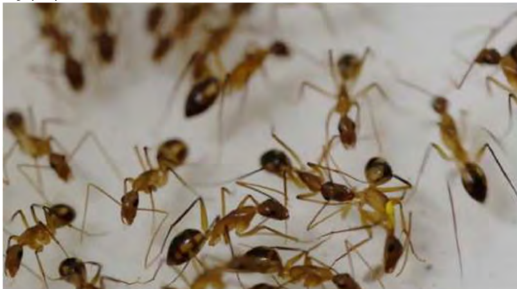
Люди не єдині, хто ампутує кінцівки пораненим товаришам. Виявилось, що це роблять мурахи

"У воскову упаковку можна загорнути хліб, фрукти й овочі, щоб зберегти їхню свіжість". Тут у пригоді стали природні антибіотичні властивості меду, які застосовували ще у Стародавній Греції. "Ми вже отримали відповідь від військових в Україні, які підхопили цю ідею, - каже Бейль. - Самі ми - у безпеці. І якщо хоч якось можемо допомогти, то це вже вартує зусиль".