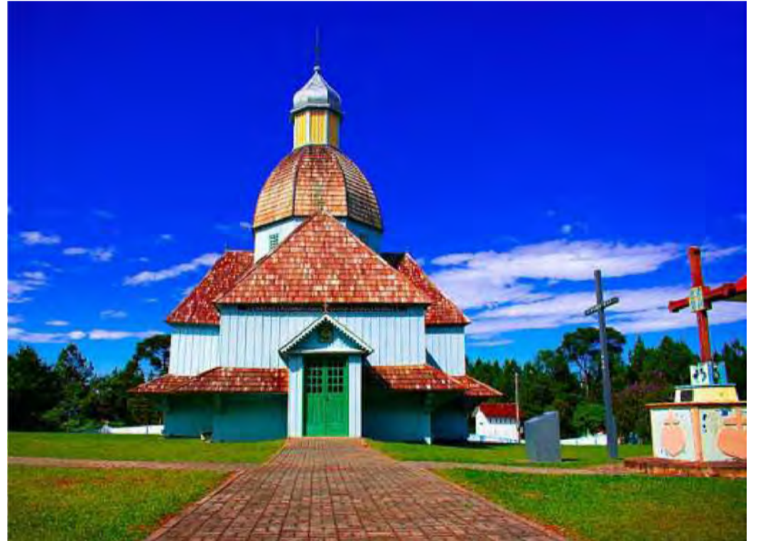
Igreja São Miguel Arcanjo

Lei N° 1513/2022, sancionada em 05 de julho de 2022, a qual “Oficializa a Língua Ucraniana como Patrimônio Cultural Imaterial do Município de Mallet...[...] ”.