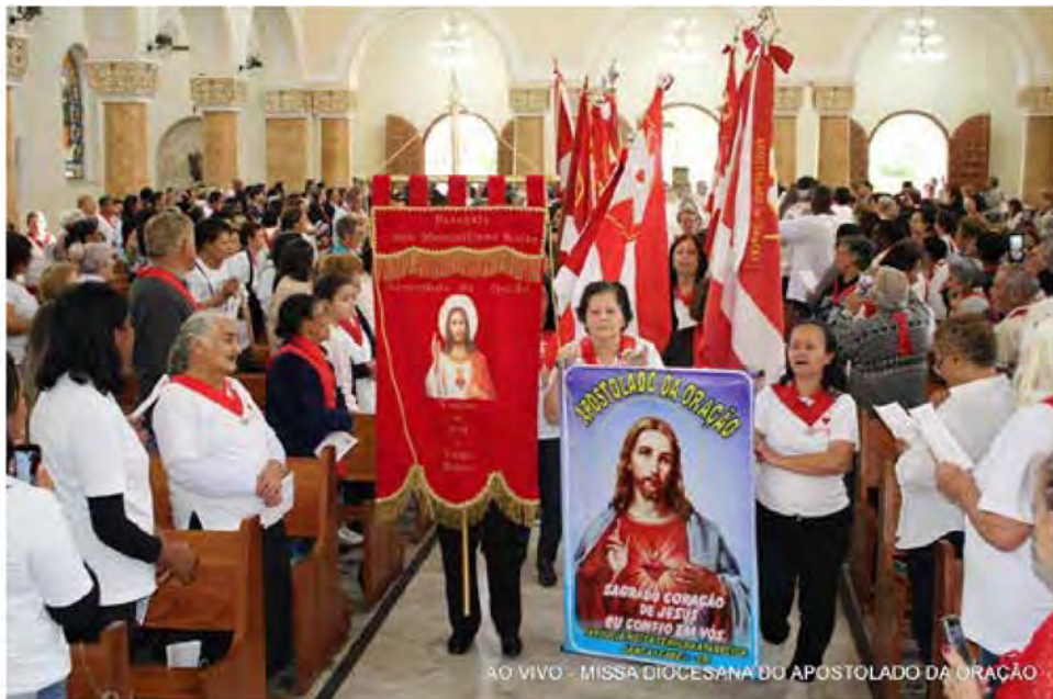
AO VIVO - MISSA DIOCESANA DO APOSTOLADO DA ORAÇÃO