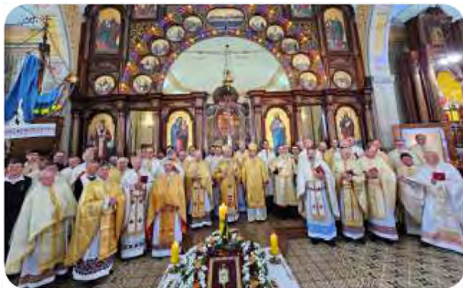
Foto da celebração do dia 12 de novembro de 2023